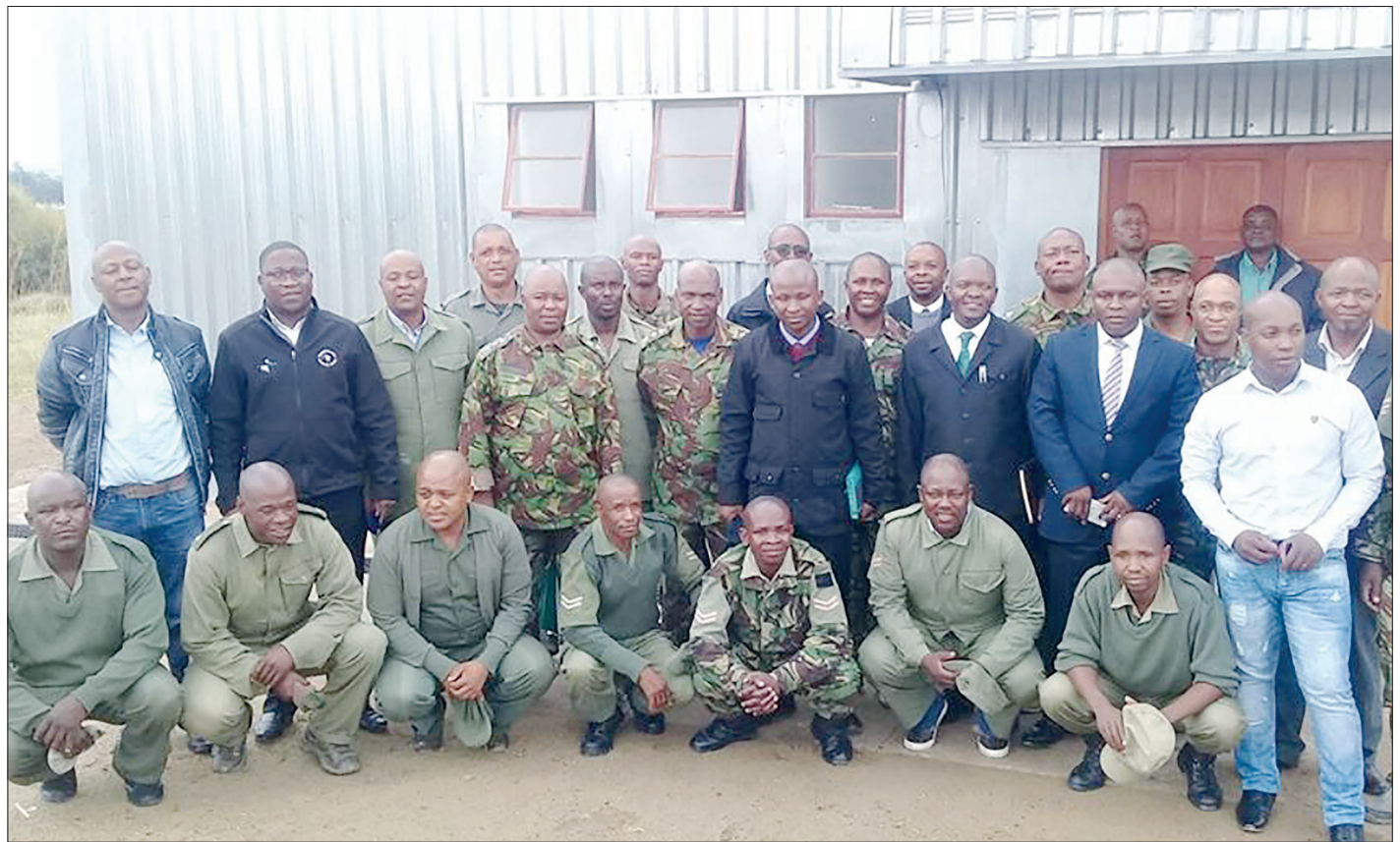
Litho tsa sesole tse ileng tsa hlokofofatsa

.....ka hore tšela ka metsi a batang Setibing