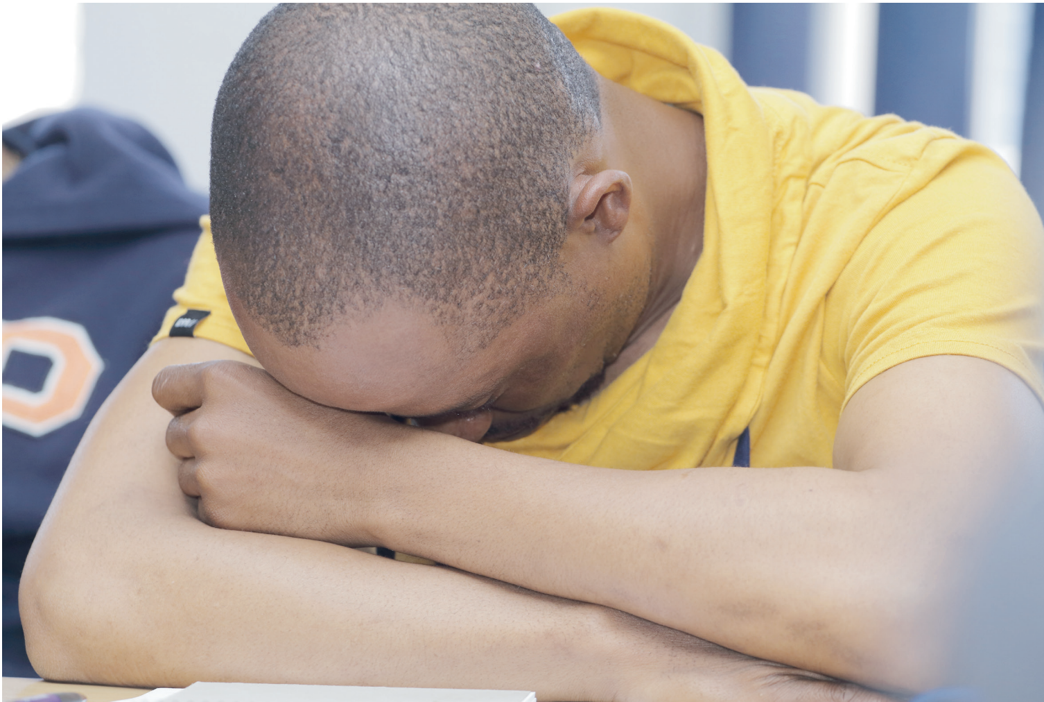
E mong oa mahlasipa a Koro-Koro

Ba boetse ba supa hore ba ne ba palame likoloi tse tharo tse fapakaneng ka nako eo eleng moo ba ileng ba etsa qeto ea ho fetola tsela eo ba neng ba tsamaea ka eona,