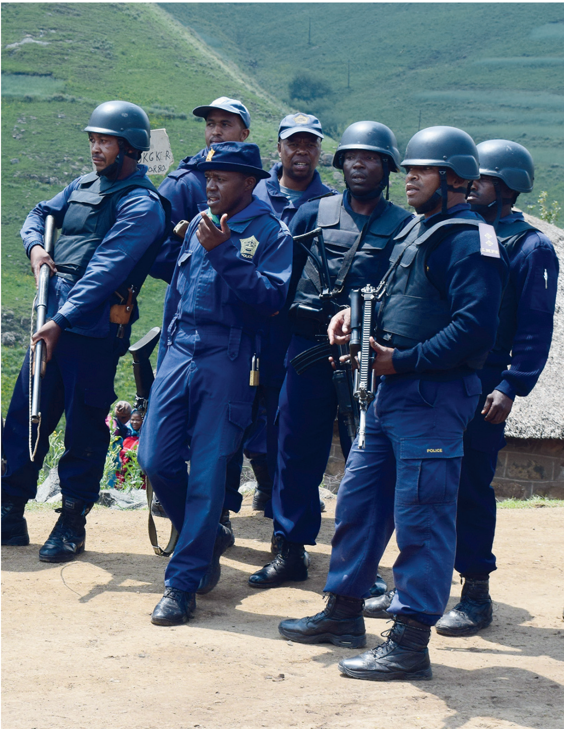
Sepolesa sa Botha-Bothe