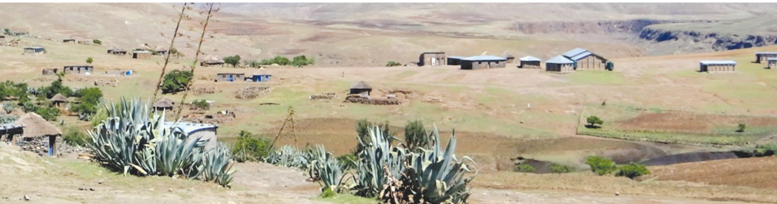
Sekolo sa Phohla se tlokoetsing ea phalliso