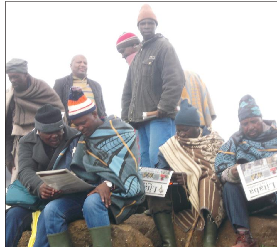
Ba bang ba baahi ba bileng teng pitsong