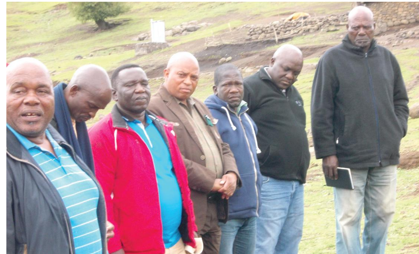
Ba bang ba litho tsa Komiti ea Paramente ba bileng teng lipitsong

Sechaba se boetse se batla ho fallisoa kaofeela libakeng tse tlang ho angoa ke morero hobane ba na le ts'abo ea hore metsi a tla cheka ka tlas'a lefaats'e, a runye a nt'o ba liella matlo. Ba ipilelitse hape ho morero ho ba lokisetsa litsela le ho ba kenyetsa motlakase ka le reng esale morero o mene-ka nako e telele ha sechaba se ba atamela ka litaba tsena, o lula o nts'o ba ts'episa feela o sa phethahatse.