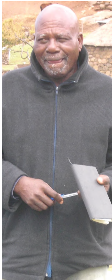
Mokhethoa oa Bela-Bela Lits'oane Lits'oane

A re ha hona motse leha ele o le mong oo morero oo qobang hobane o na le litaba, a re ha e eo taba e joalo, empa taba ea bopotiele ha e-so etsoe