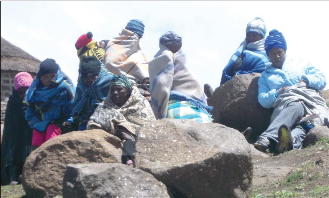
Basali ba metse e tla angoa ke letamo ba 'nts'a maikutlo a bona ka morero

mabare-bare a ntseng a ipetsa ka har'a motse ha ho qoqa ka litaba tsa morero. O boetse a bolela hore boliba ba letamo bo tlo ba koalla tsela eo ba neng ba tsamaea ho eona ho ea roalla libeso tseo ba li sebe-lisang ho pheha. Basali bana ba Basotho ba phelang ka thoko ho meo-loane ba itse letamo le tlo ba bakela tlokotsi ea bana batlo kolumela bolibeng hammoho le liphoofolo tsa bona. Mosali e mong eena o bo-letse hore ba bile ba tla aroha-na le baahisane ba bona bao ba neng ba alimana thepa ha-holo e ba thusang masimomg, hammoho le ho qellana lijo nakong ea tlala eleng se khut-lisetsang bophelo ba bona te-te-te!