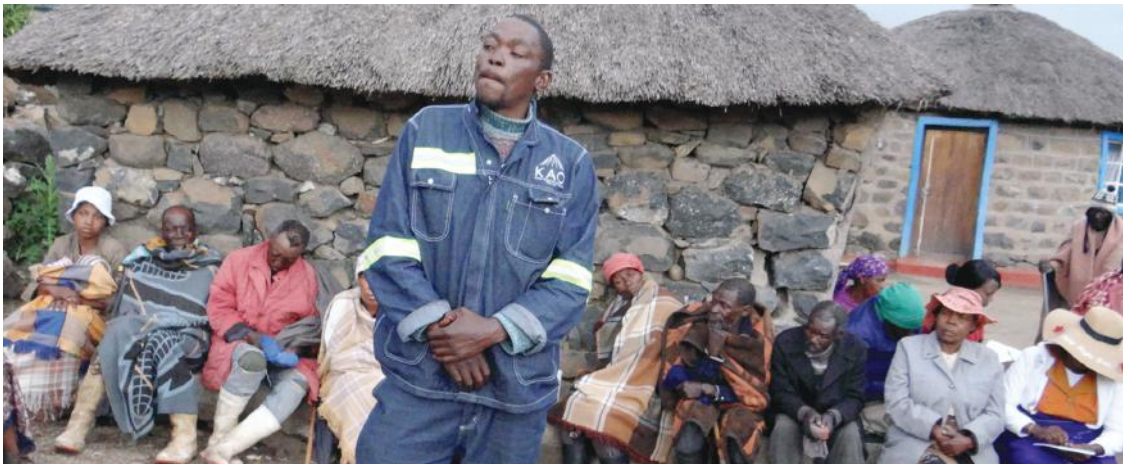
Tseko Ratia o bua ka matla ka litaba tsa ka morafong

sechaba hore ba tllil’o rarolla bothata bona, kaha hona le leano la merafo la naha leo merafo eohle e lokelang ho ikamahanya le lona. A re ba tlo boela ba khutlela sechabeng mabapi le litaba tsena kamora hore ele komiti ba kopane ho rala tsela ea ts’ebetso le hore na ba tla atamela morafo joang ho bona hore lillo tsa sechaba liea arabeleha. O phethetse ka ho supa hore ena ke eona thomo eo ba e fuoeeng ke mohlomphehi tonakholo ea hore lits’ebeletso li lokela ho ea sechabeng.