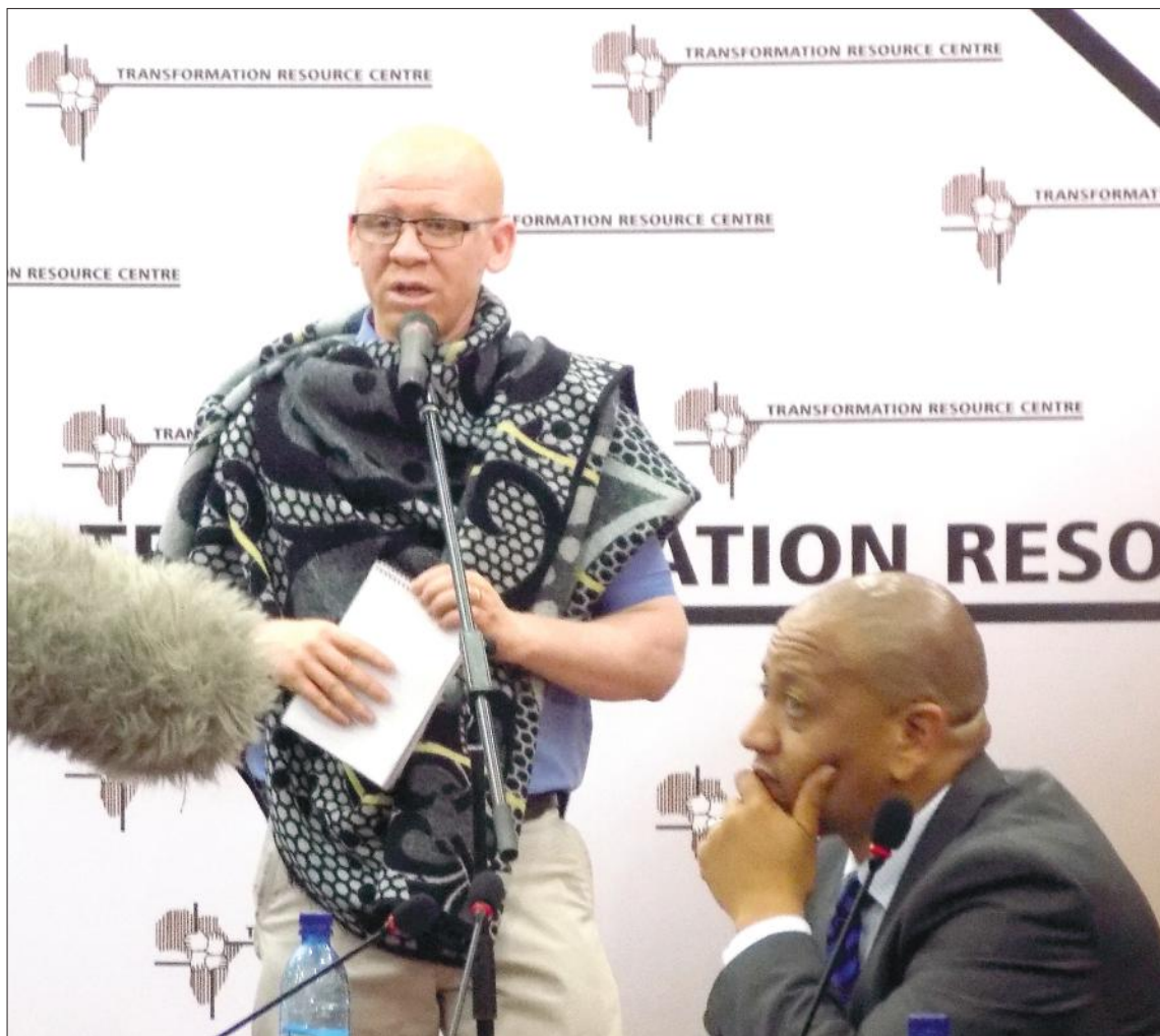
Mookameli oa TRC ‘moho le Mongoli e Moholo oa muso Monghali Moahloli Mphaka’mokeng oa sechaba

‘Moka ona oa TRC o bile oa totobatsa bohlokoa ba phutheho e joalo kaha e tla thusa ho etsa hore ho be bonolo ho ba tlang ho nka karolo morerong oa tlhopho bocha hore ba fumane maikutlo a sechaba ka mafapha a thusang tsamaisong ea puso ea sechaba ka sechaba le ho loanela litokelo tsa mantlha tsa botho.