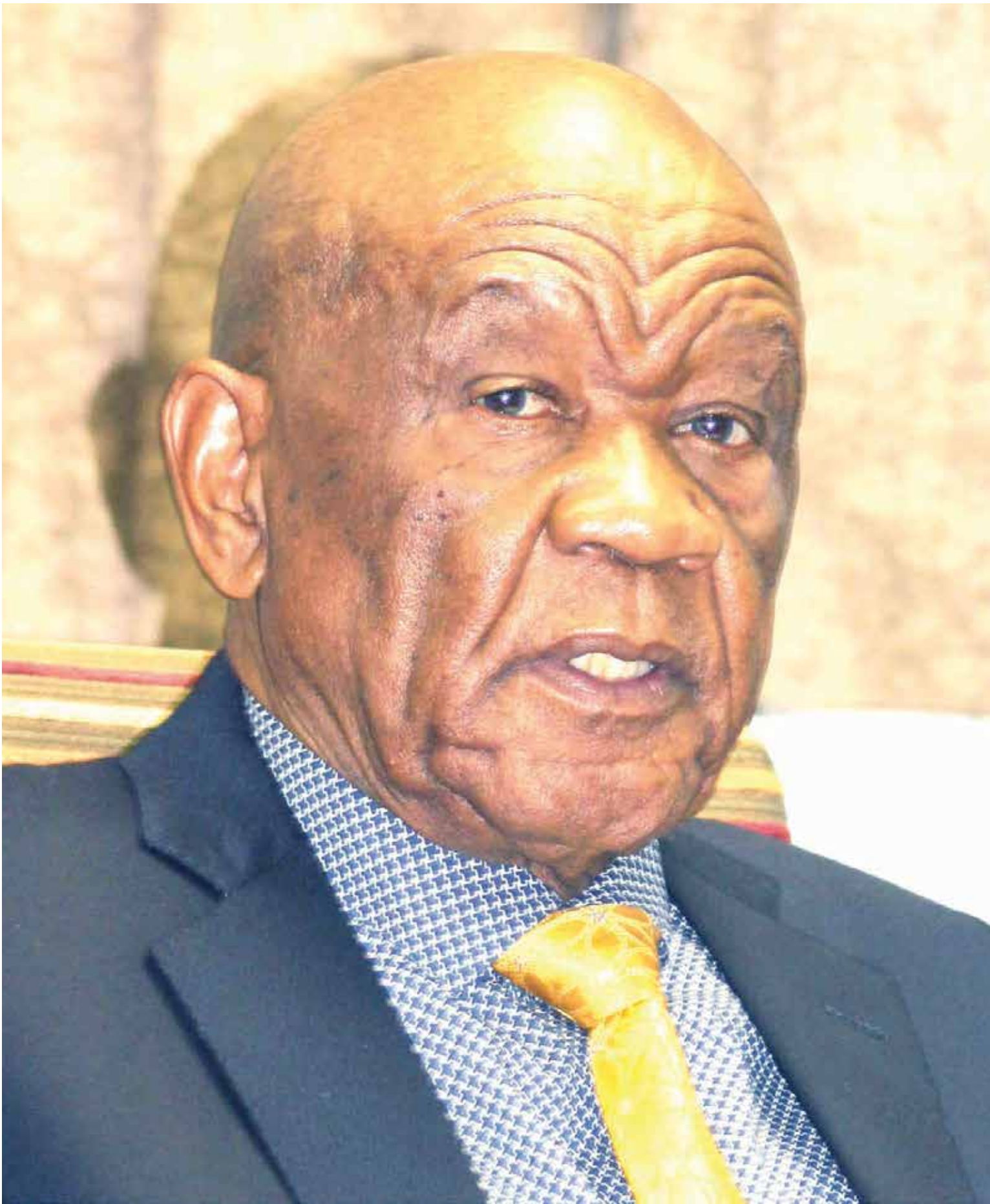
Tonakholo Dr Motsoahae Thomas Thabane