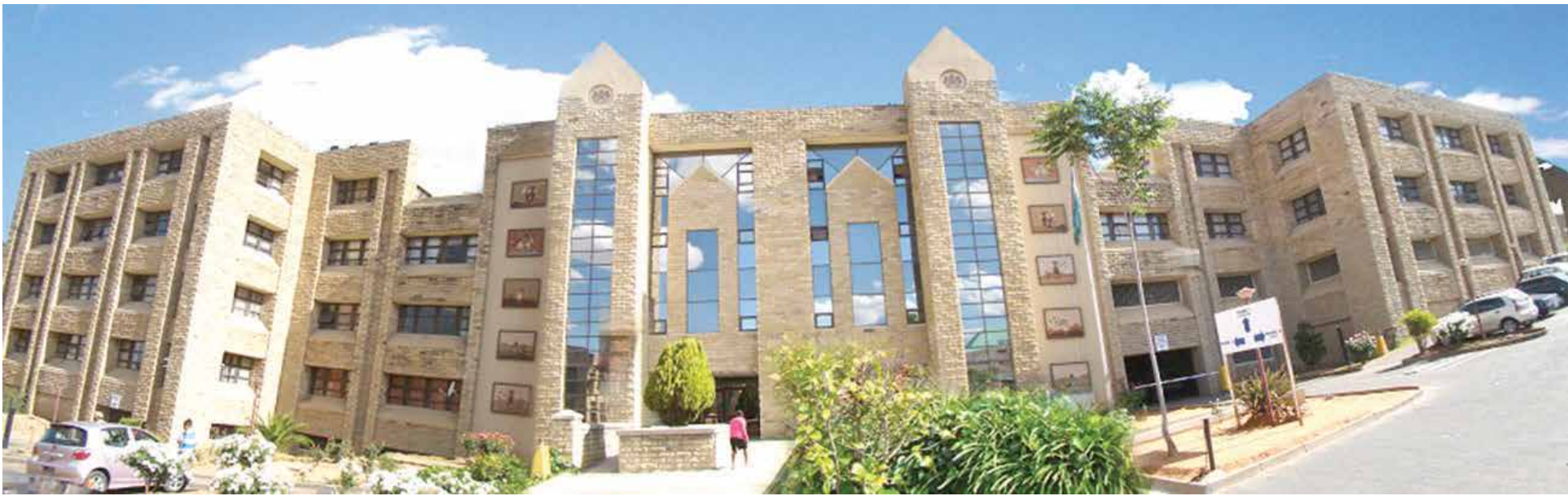
Liofisi tsa lekala la lichelete Qhobosheaneng - Maseru