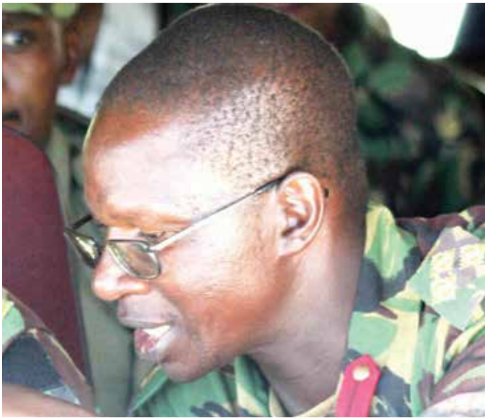
Lt. Gen Maaparankoe Mahao