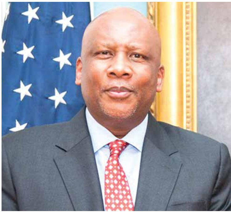
Motlotlehi Letsie III

MASERU – Sechaba sa Basotho se bonahetseng se halefisoa ke ho se be le lentsoe hoa Motlotlehi Letsie III, se thabile haholo nakong eo a neng a bua ka thata ha a thakhola qaleho ea litaba tsa Tlhopho Bocha ea melao ea naha ea Lesotho.