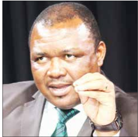
Ba tla hopoloa ka ho etella pele mebuso e makhotla a matona a leng maholo