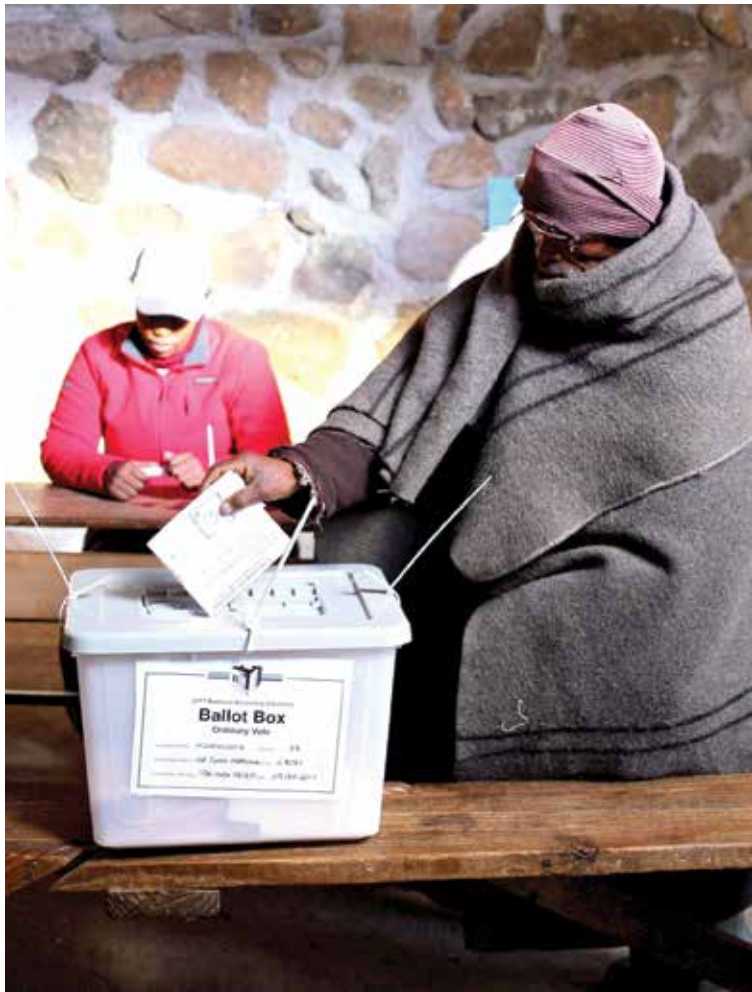
Likhethong tsa 2017

O boetse a supa hore mokhoa ona oo naha ea Lesotho e ntseng e o sebelisa hajoale oa masia-siane o lokela ho lahloa kaha o bakela naha ena mathata, kaha joale ho bonahala ho ntse ho runya mekha e mengata ea lipolotiki, kaha le ngoliso feela ea makhotala a joalo ele bobebe kaha ho lebelletsoe hore motho bonyane abe a ena le batho ba makholo a mahlano 'me hone hoka loka ha ene eka eketsoa hoba likete tse robeli. A re le tsela eo feela ho ajoang litulo tsa khekhethane ka eona ese e ntse e lokela ho lokisoa kaha efa eona mekha ena monyetla oa ho kena ka hare ho paramente leha ba